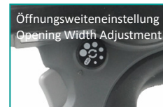
Öffnungsweiteinstellung Opening Width Adjustment